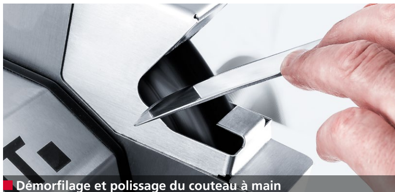
■ Démorfilage et polissage du couteau à main

L'EVO5 est une affûteuse robuste et fiable pour le secteur de la restauration, les boucheries, les ateliers de découpe, les services d'affûtage, etc.