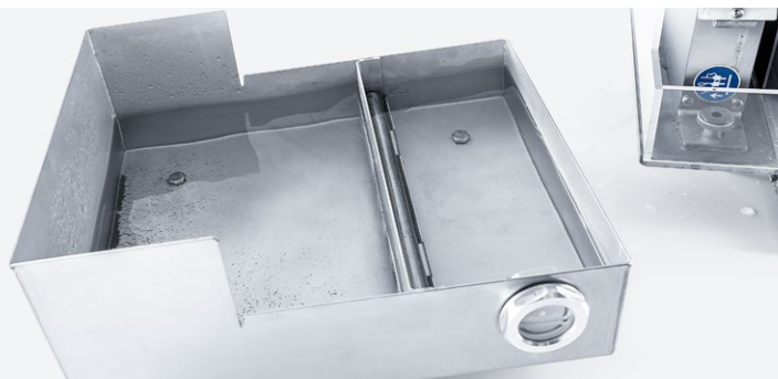
■ Réservoir à eau