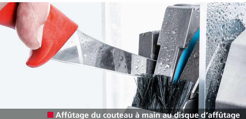
■ Affûtage du couteau à main au disque d'affûtage