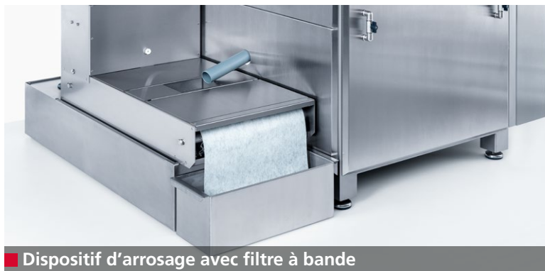
■ Dispositif d'arrosage avec filtre à bande

La W 40 est entièrement hermétique. Toute mise en marche involontaire d'un entraînement lorsque la porte est ouverte est impossible. L'unité d'aspiration intégrée permet d'évacuer le brouillard formé par les poussières d'affûtage dans la chambre de travail. On garde ainsi une très bonne visibilité sur le processus d'affûtage. Les voies respiratoires de l'opérateur sont ainsi protégées.