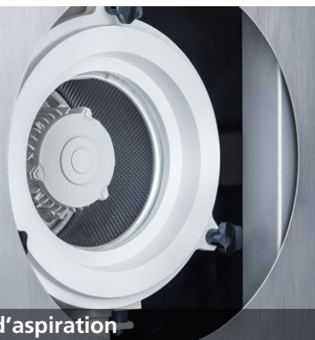
■ Unité d'aspiration

Chambre de travail hermétique et refroidissement permanent des pièces