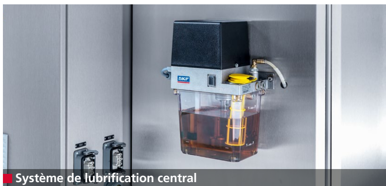
Système de lubrification central

L'affûteuse W40 assure l'exécution d'affûtages plans et parallèles, une excellente qualité de surface et de hautes performances d'affûtage. Toutes les conditions sont ainsi réunies pour assurer une coupe de haute qualité de la viande. L'objectif est d'assurer une capacité de coupe constante sur toute la durée de vie des jeux d'outils de coupe.