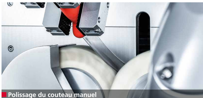
■ Polissage du couteau manuel

L'affûteuse E 50RT affûte de manière entièrement automatique des couteaux à main de diverses formes et tailles.