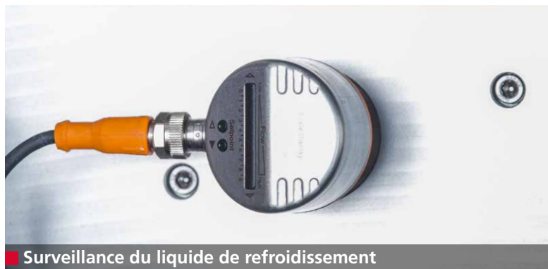
■ Surveillance du liquide de refroidissement

L'unité d'aspiration de série et le système de refroidissement à eau réduisent nettement toutes les émissions générées par les opérations d'affûtage et de polissage. Les voies respiratoires de l'opérateur sont ainsi protégées.