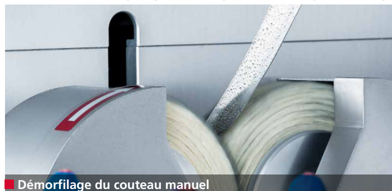
■ Démorfilage du couteau manuel

Les coupes précises optimisent la qualité du produit