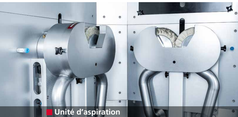
■ Unité d'aspiration

Machine totalement hermétique avec unité d'aspiration et refroidissement à eau