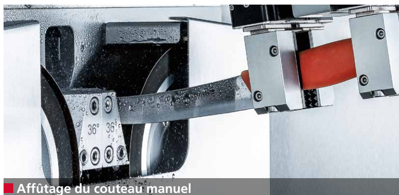
■ Affûtage du couteau manuel

Les couteaux à main parfaitement affûtés permettent d'exécuter des coupes précises. En comparaison avec un affûtage manuel, l'utilisation de couteaux à main affûtés à l'aide de la robotique de l'E 50 RT permet d'obtenir un accroissement de 0,5% du rendement en viande. Pour une production de viande de 10 000 tonnes, cela représente un rendement accru de 50 000 kg.