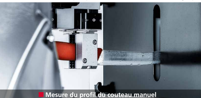
■ Mesure du profil du couteau manuel

La robotique permet d'obtenir un affûtage parfait des couteaux à main