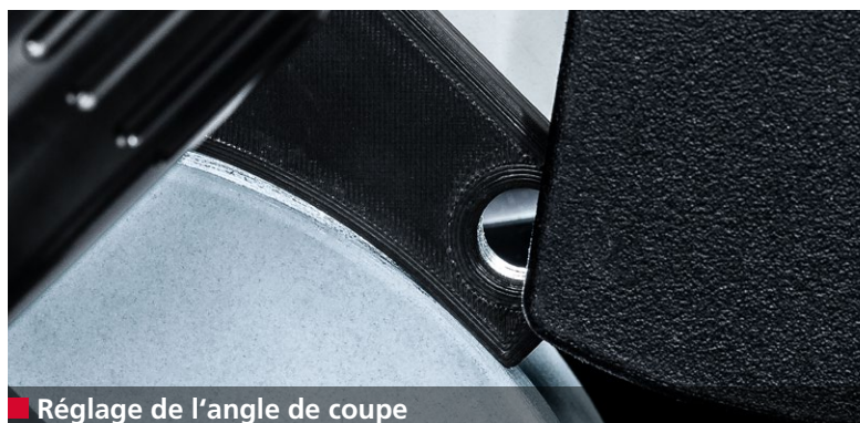
■ Réglage de l'angle de coupe

Le processus de découpe et de tranchage dans la production alimentaire doit être le plus net possible. L'écrasement – la compression – le déchirement etc. réduisent la qualité des aliments. L'affûteuse A400 produit des arêtes de coupe d'une précision et d'une qualité maximales.