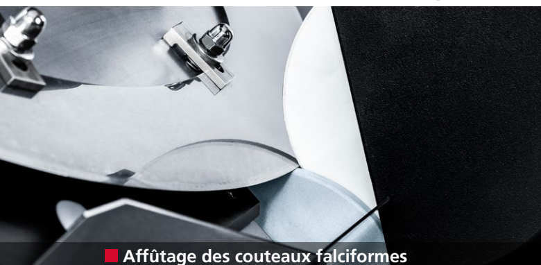
■ Affûtage des couteaux falciformes

Couteaux falciformes affûtés avec précision