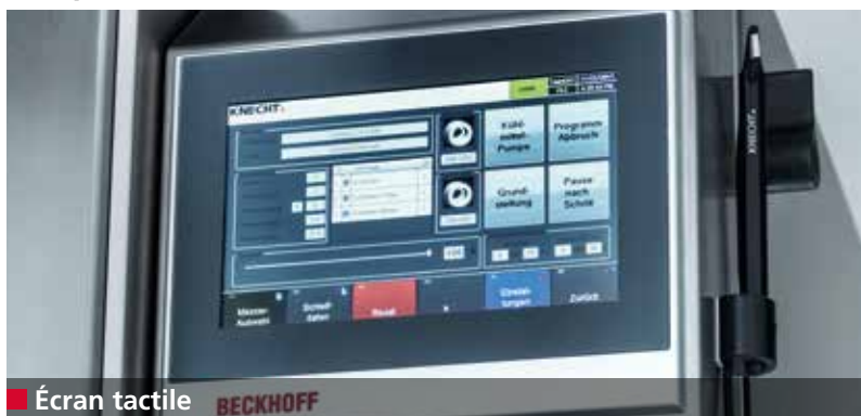
■ Écran tactile BECKHOFF