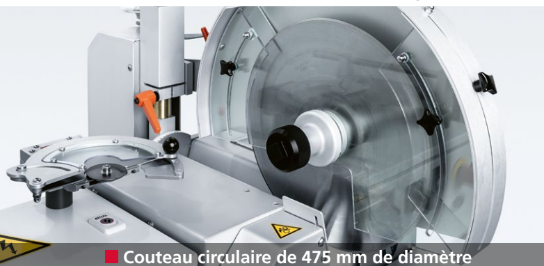
■ Couteau circulaire de 475 mm de diamètre

Grâce à des couteaux circulaires parfaitement affûtés