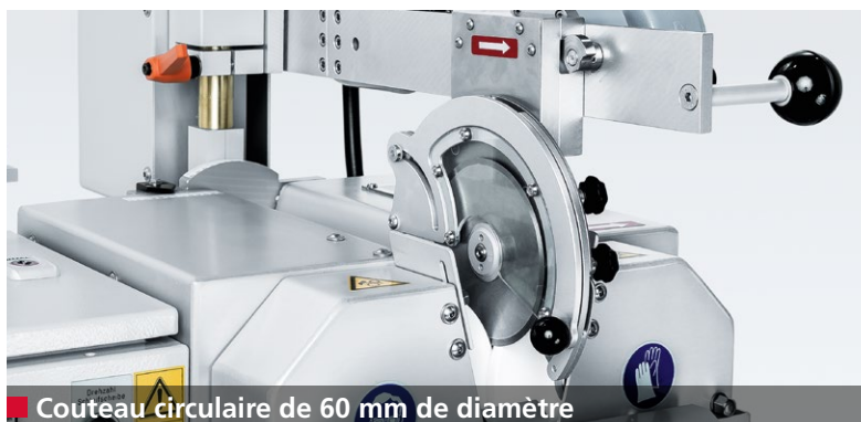
■ Couteau circulaire de 60 mm de diamètre

Le tranchant, l'angle de coupe et la largeur de biseau d'un couteau circulaire ont un grand impact sur la qualité de coupe des produits.