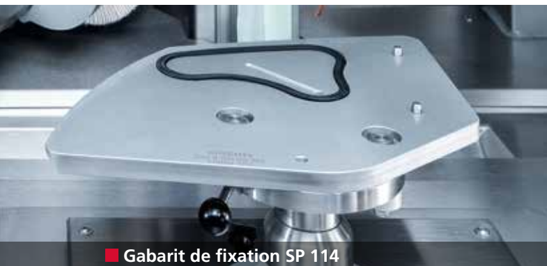
■ Gabarit de fixation SP 114

Affûtage entièrement automatique du couteau de cutter