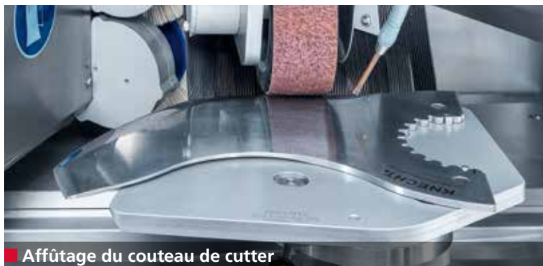
■ Affûtage du couteau de cutter

Le tranchant, l'angle de coupe, la forme et le profil d'un couteau de cutter ont un grand impact sur la qualité des produits fabriqués.