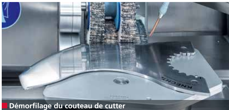
■ Démorfilage du couteau de cutter

La B 600 affûte, polit et démorfile automatiquement les couteaux de cutter jusqu'à 1000 l. Le changeur de couteaux retire le couteau du magasin, se met en position d'affûtage, et démarre le programme d'affûtage. Lorsque l'opération d'affûtage est terminée, le changeur de couteaux ramène le couteau de cutter affûté dans le magasin et retire le couteau suivant. La machine traite jusqu'à 16 couteaux de cutter sans intervention humaine.