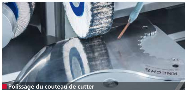
■ Polissage du couteau de cutter