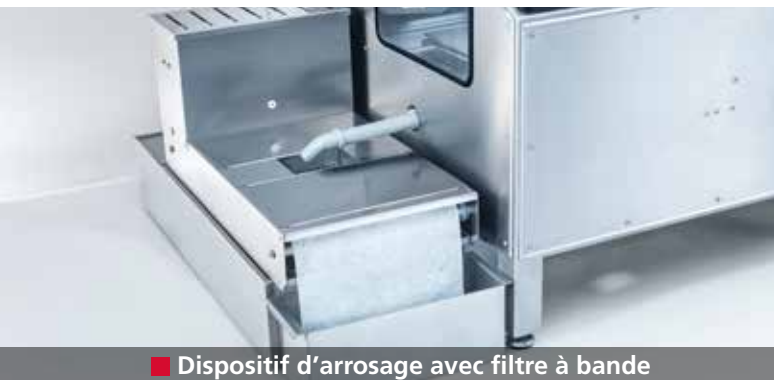
■ Dispositif d'arrosage avec filtre à bande

Chambre de travail hermétique et refroidissement permanent des pièces