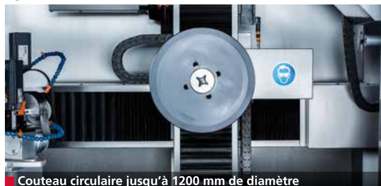
■ Couteau circulaire jusqu'à 1200 mm de diamètre

Le passage d'un couteau falciforme à un couteau circulaire s'effectue très rapidement. Positionner l'assise à couteaux et le couteau, sélectionner le programme d'affûtage et démarrer la machine.