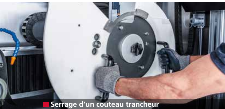
■ Serrage d'un couteau trancheur

Affûtage entièrement automatique des couteaux trancheurs