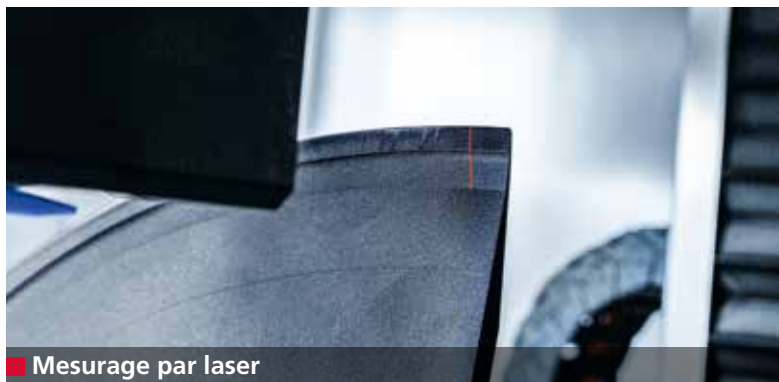
■ Mesurage par laser

Des coupes parfaites, des surfaces sans stries et des produits déposés avec précision. L'A 95 assure une grande précision d'affûtage des couteaux trancheurs, ce qui permet de remplir les conditions précitées.