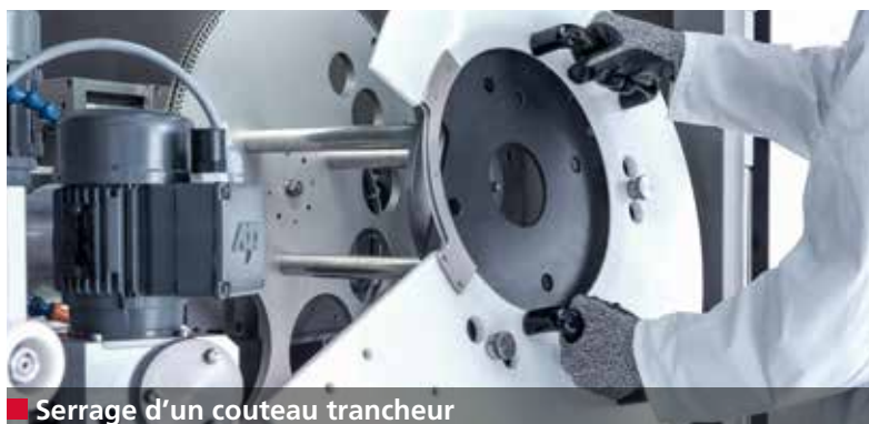
■ Serrage d'un couteau trancheur

Des coupes parfaites, des surfaces sans stries et des produits déposés avec précision. L'A 950 II assure une grande précision d'affûtage des couteaux trancheurs, ce qui permet de répondre à ces critères.