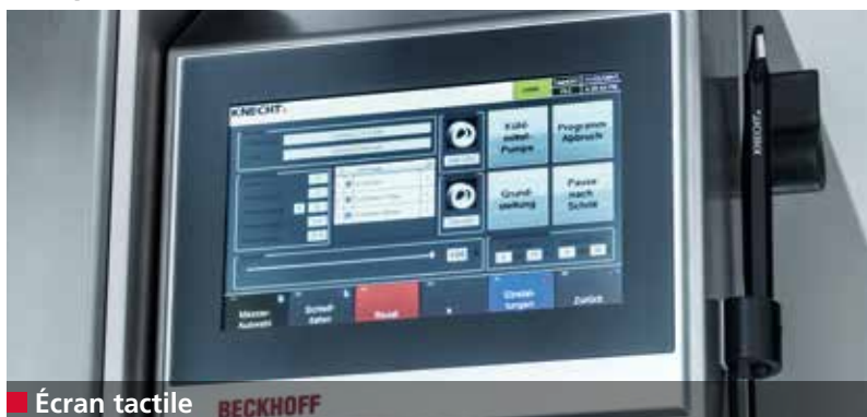
■ Écran tactile BECKHOFF