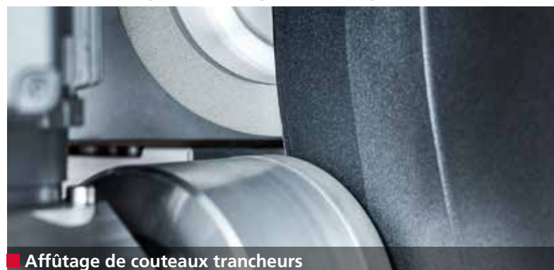
■ Affûtage de couteaux trancheurs

Des produits déposés avec précision et des surfaces parfaites