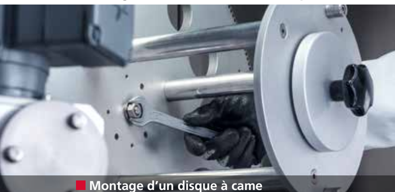
■ Montage d'un disque à came

Affûtage entièrement automatique des couteaux trancheurs